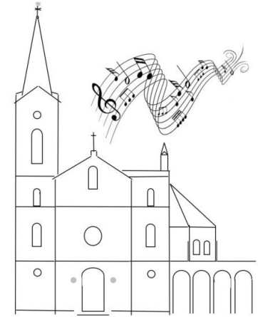
Freundeskreis für Kirchenmusik der Ev. Kirchengemeinde Essen-Kupferdreh

Freundeskreis für Kirchenmusik der Ev. Kirchengemeinde Essen-Kupferdreh III. Hagen 39, 45127 Essen freundeskreis@kgm-kupferdreh.de www.kgm-kupferdreh.de