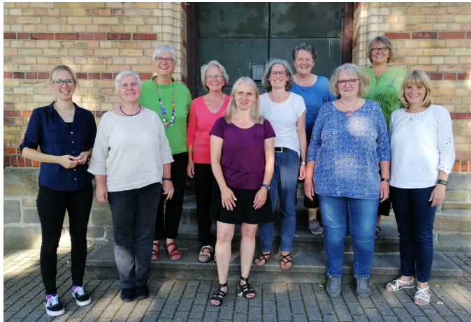
Frauenchor Contrapunkt 2022

An den Freundeskreis für Kirchenmusik der Ev. Kirchengemeinde Essen-Kupferdreh III. Hagen 39 45127 Essen