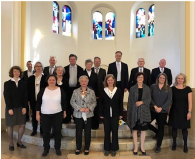
Chor der Christuskirche 2020, 125. Chorjubiläum

Freundeskreis für Kirchenmusik der Ev. Kirchengemeinde Essen-Kupferdreh III. Hagen 39, 45127 Essen freundeskreis@kgm-kupferdreh.de www.kgm-kupferdreh.de